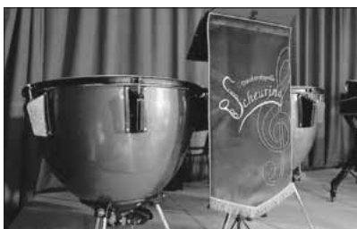
Neue Pauken und Notenpulttücher für die Scheuringer Musik

Die Trachtenkapelle hat ein Crowdfunding-Projekt gestartet und braucht nun Ihre Unterstützung, um die notwendigen Anschaffungen in 2026 finanziell stemmen zu können. Worum geht es dabei?