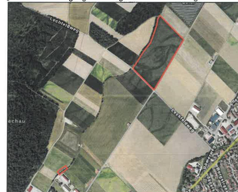
Umgriff vorhabenbezogener Bebauungsplan „Nahwärmeversorgung Scheuring: PV-Freiflächenanlage und Heizzentrale“

Die Verarbeitung personenbezogener Daten erfolgt auf der Grundlage der Art. 6 Abs. 1 Buchstabe e (DSGVO) i.V.m. § 3 BauGB und dem BayDSG. Sofern Sie Ihre Stellungnahme ohne Absenderangaben abgeben, erhalten Sie keine Mitteilung über das Ergebnis der Abwägung. Weitere Informationen entnehmen Sie bitte dem Formblatt „Datenschutzrechtliche Informationspflichten im Bauleitplanverfahren nach Art. 13 und 14 DSGVO“, das ebenfalls öffentlich ausliegt.