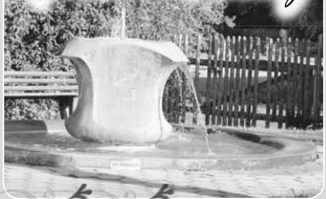
Scheuring - Dorfbrunnen