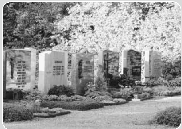
Scheuring - Friedhof