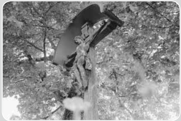
Scheuring - Feldkreuz