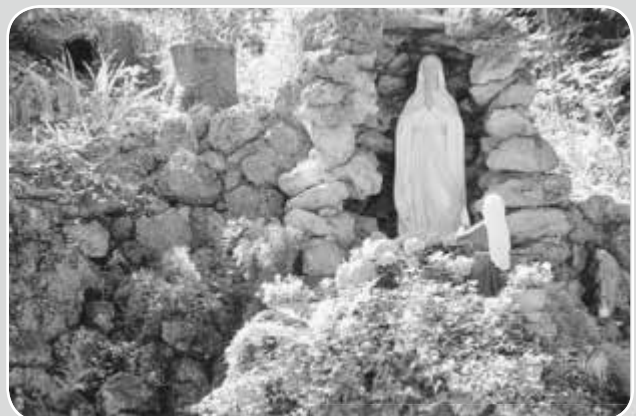
Scheuring - Grotte